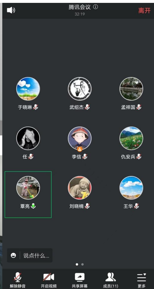
线上学习确保学习不断档

闻令而动，支部党员积极投身校园疫情防控一线 党员干部积极响应、迅速行动，努力在疫情防控工作中发挥积极作用。一是统筹抓好建设项目疫情防控安全管理。按照学校疫情防控部署要求，加强对施工单位、监理单位等参建单位的动态跟踪了解，强化落实施工单位疫情防控 and 安全管理主体责任。二是积极投身疫情防控志愿服务工作。支部党员主动报名参加“机关党委疫情