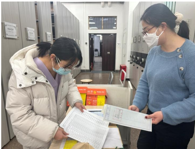
👉 查阅工程档案资料确保基础信息准确性

院路本部、昌平创新园、西三旗中试基地、管庄校区存量建设用地，摸清地上地下建筑基础信息的“家底”，建立建筑信息基础台账，依据《北京市城乡规划条例》《北京城市总体规划（2016年—2035年）》《北京市城市更