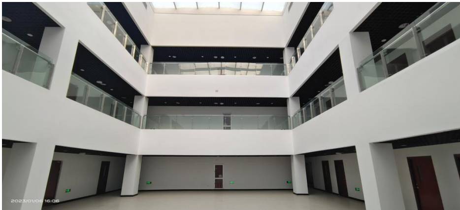
西区B区三至五层中央采光大厅