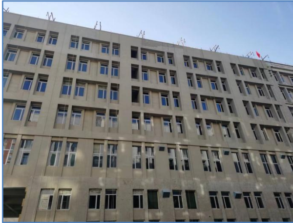
👉 工程实践基地（二期）外立面施工进度