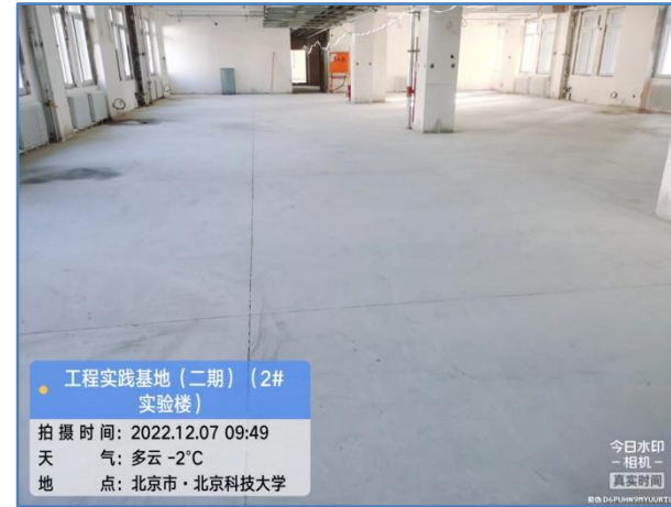
● 工程实践基地（二期）（2# 实验楼） 拍摄时间：2022.12.07 09:49 天气：多云 -2°C 地点：北京市·北京科技大学