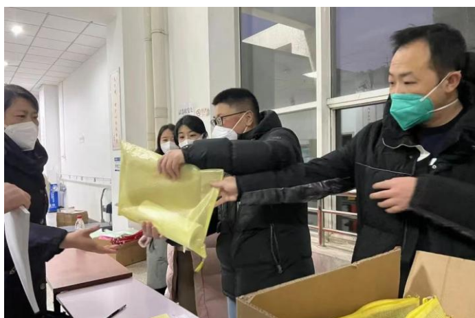
📷 报名参加研究生招生考试考务工作

防控突击队”，1 人入驻教学区协助做好信息录入、核酸检测等工作，2 人作为应急处置志愿者为 16 斋隔离人员发餐，为教学区疫情防控教师传递生活物资，支援离退休干部处为离退休老同志发药。三是主动报名参与 2023 年硕士研究生招生考试监考考务工作。在听闻监考考务人员缺额的情况下，基建处党支部全体动员，9 人主动报名，4 人承担监考考务任务。