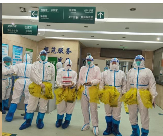
📷 参与教学区核酸检测