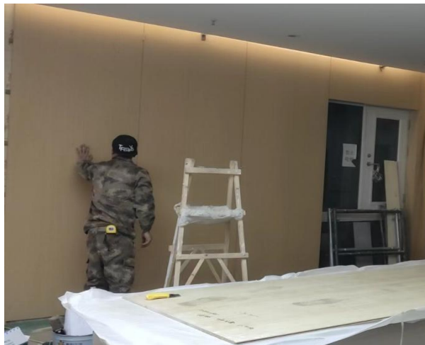
👉 工程实践基地（一期）五-六层改造项目施工进度