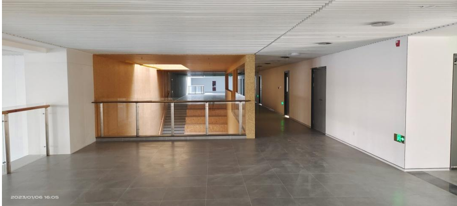
西区B区二层走廊精装区域