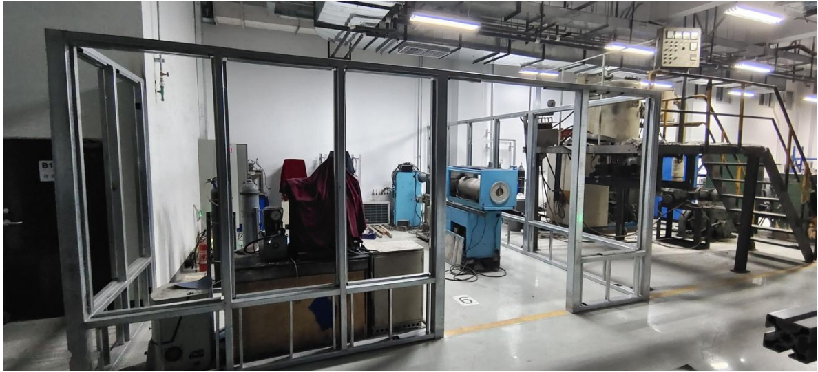
👉 工程实践基地（一期）地下一至四层实验室隔断龙骨安装