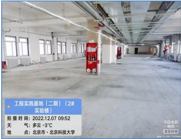
● 工程实践基地（二期）（2# 实验楼） 拍摄时间：2022.12.07 09:52 天气：多云 -3°C 地点：北京市·北京科技大学