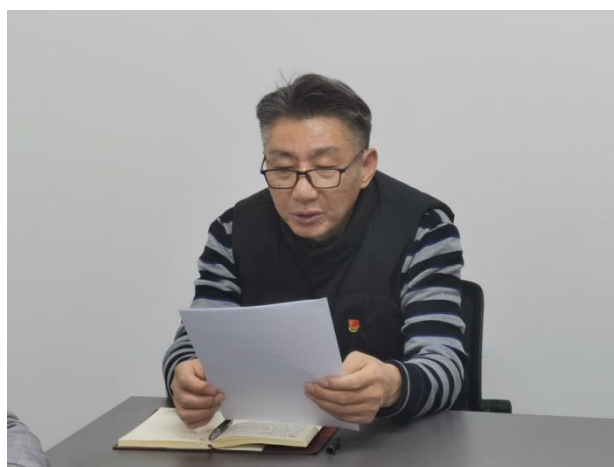
支部书记带头领学