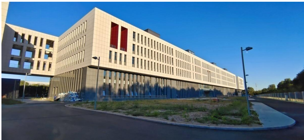
西区建筑主体与室外工程

工程实践基地（一期）改造 地下一层至四层改造——取得施工许可证，制定切实可行的施工方案，完成实验室隔断龙骨制作安装、墙体开洞、机电设备采购。五-六层改造——完成实验室地面、墙面及顶棚施工，机电管线及设备安装，通风及空调安装等施工内容。